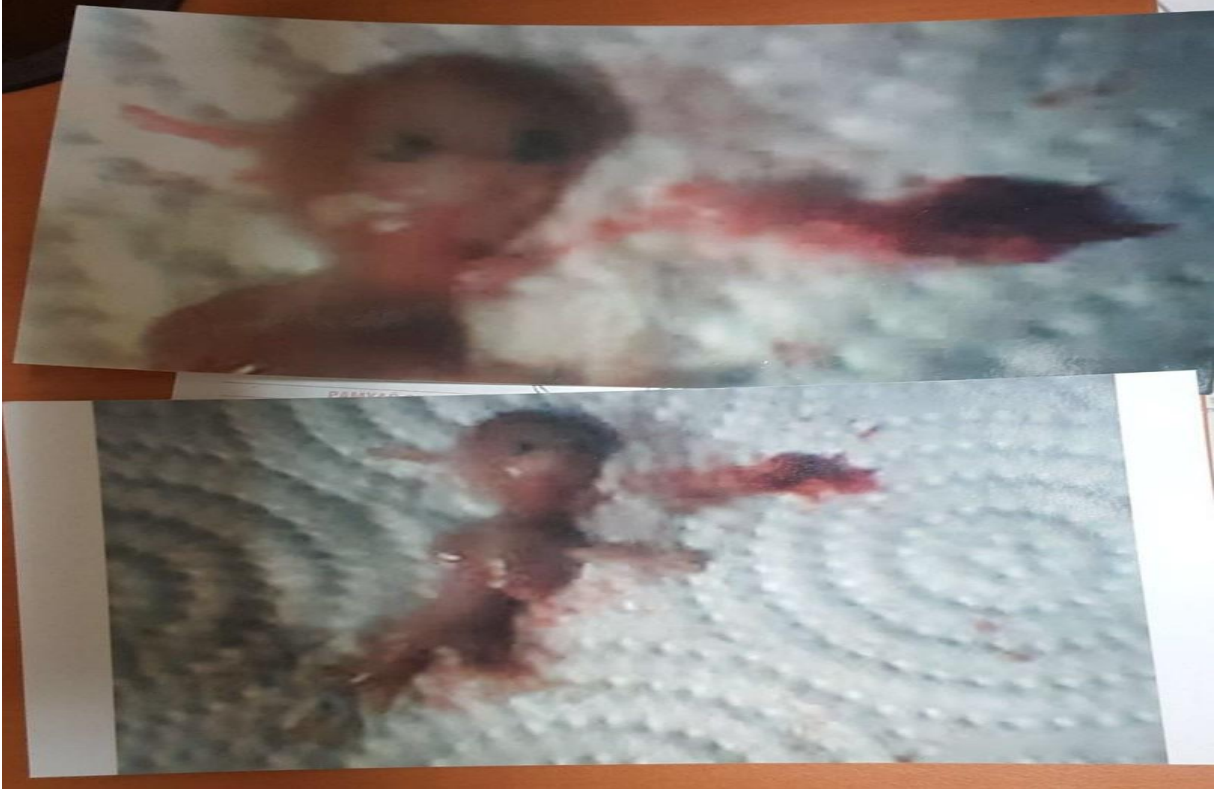
Resim-1: Şahsın eşine gönderdiği ve dava dosyasına giren fotoęraflar.

Olayın adli makamlara intikal etmesi ile şahsın eşine gönderdiği düşük materyalini içeren 2 adet fotoęraf dava dosyasına eklenmiştir. Şahıs, mevzubahis darp olayı ile gerçekleştięi iddia olunan düşük olayının arasında illiyet olup olmadığının tespiti açısından dava dosyası ile birlikte Gaziantep Üniversitesi Adli Tıp Anabilim Dalına gönderilmiştir.