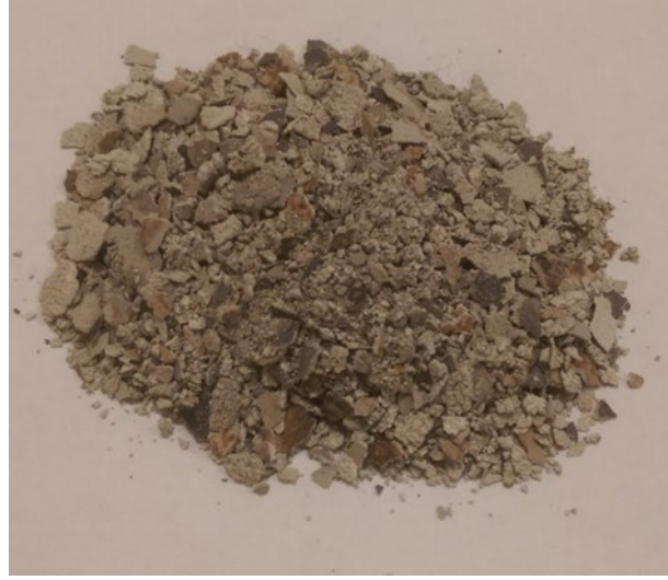
Şekil 2. Piston başından alınan depozitlerin görünümü

Kömürcüoda Çöp Depolama Sahası'nda Kurulu olan elektrik üretim tesisindeki gaz motorunun piston başlarında biriken depozitler hafifçe kazımak suretiyle alınmıştır. Yaklaşık 100 gram seviyesinde alınan numune temiz plastik poşetin içine konarak analiz yapılacak laboratuvara nakledilmiştir. Motorun piston başlarından alınan depozit Şekil 2'de gösterilmiştir.