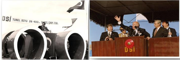
Fotoğraf 3 ve 4: Cumhurbaşkanı Süleyman Demirel, açılış konuşmasını Necmettin Cevheri'yle birlikte 1977 yılında yaptığı ve kimseye gaptırmam dediği GAP tünellerinin açılışında (1993) konuşuyor.

yararı olduğunu görmedim. Ama hem dünya görüşü itibariyle Partiye yakın, hem de nitelikve kapasitesi üstünse, o insana görev verilmelidir. Verdik de. ... Burada sadece 1995 yılına kadar önce DEMİREL'in, sonra da ÇİLLER'in Başbakanlığında icraat yapan Koalisyon Hükümetlerinin Urfa'ya hizmetleriyle ilgili bir parantez açmak istiyorum. Bunların en başında, şüphesiz yalnız Urfa'nın değil, Türkiye'nin de hudutlarını aşan GAP Projesi gelir. 3 Nisan 1977'de Adalet Partisi'nin başında olduğu Hükümet döneminde, devrin Başbakanı DEMİREL tarafından temeli atılan Urfa Tünelleri, 9 Kasım 1994'de, Cumhurbaşkanı DEMİREL ve Başbakan ÇİLLER tarafından açıldı."