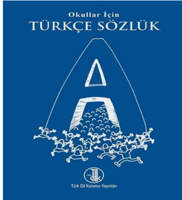
Şekil 3. İncelenen Sözlüğün Kapak Görselleri

Times new roman yazı tipinin kullanıldığı sözlükte tercih edilen yazı puntosu ebadı ise 9'dur. Yazı puntosu öğrenci seviyesine uygun değildir çünkü Millî Eğitim Bakanlığı Ders Kitapları ve Eğitim Araçları Yönetmeliği'nde (2021: 4) beşinci sınıflar için 11, altı, yedi ve sekizinci sınıflar için ise 10 puntodan aşağı olmaması gerektiği belirtilmiştir. Dolayısıyla sözlüğün yazı puntosu öğrenci seviyesinin gerektirdiği standardın altında kalmıştır.