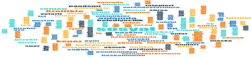
Şekil 2: Sosyal Belediyeçiliğe Yönelik Kelime Bulutu

Görüşmelerden elde edilen verilerin çözümlenmesiyle birlikte sosyal belediyeçiliğe yönelik kelime bulutu analizi yapılmıştır. Görüşmecilerden elde edilen transkriptlerde iki harf ve daha üzeri kelimeler analiz kapsamına konulmuş ve karşımıza sayıca en çok kullanılan kavramın “sosyal” olduğu görülmüştür.