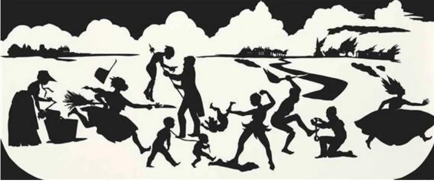
Şekil 8. Kara walker, Beyaz İsyân İçin Çalışma ( Study for White Riot), Kolaj, 33.6 x 80.9 cm, 1997.

Köleliğin uğradığı dönüşümün, modern toplumlarda bağlı sebepler ile ortaya çıkan durumuna odaklanmak gerekirse modern kölelik, günümüzün önemli bir problemi haline gelmiştir. Burada Köleliğin, yüklendiği anlam ve yöntem değişikliğe uğrasa da bu durum her toplumda farklı olarak ele alınabilir. Kapitalizmin ortaya koyduğu sistem üzerinden modern kölelik kavramı bu durumdaki toplum yapılarının ortaya çıkarttığı bir durumdur. Uzun mesai saatleri, çocuk işçiler ya da ağır iş yükleri buna örnek olarak gösterilebilir. Burada toplumdaki sınıf farklılıklarını da göz önünde bulundurmak gerekmektedir.