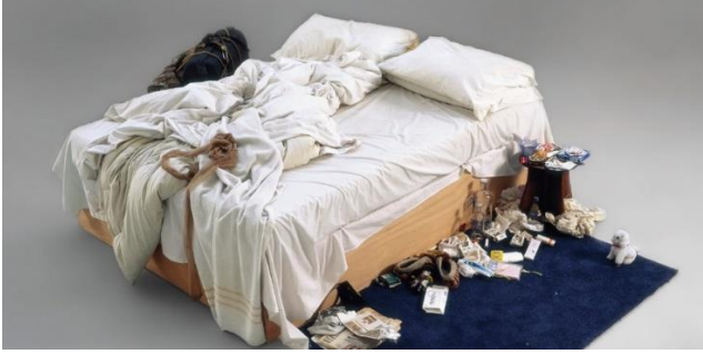
Şekil 4. Tracey Emin, Benim Yatağım 'My Bed', yerleştirme, 1998.

esinlenerek oluşturduğu çalışmaları, yola çıkan Ai Weiwei, “Kemer (Unveils "Arch")” (Şekil 3) yerleştirme çalışmasını gerçekleştirirken kendilerini çevreleyen çelik çubukları kırar gibi görünen bu karakterlerin "tüm popülasyonların serbest geçişini temsil ettiğini ve sınırların olmadığı bir dünyaya hitap ettiğini" söylemiştir. Ai Weiwei ise, Rimma Gerlovina ve Valeriy Gerlovin, 1977 tarihli “Hayvanat Bahçesi (Zoo)” (Şekil 2) performansının amacını tam zıttı olan bir yöntem ve ifade biçimi ile yansıtarak evrensel bir boyuta taşır. Sınırların, yaptırımların ve baskıların olmadığı özgür bir dünyayı vurgular. Kafes, adeta ortasındaki insan figürlerinin delip geçtiği, işlevini yitirmiş bir nesneye dönüşmüştür. İçerisinden geçenler özgürlüklerini pekiştirecek, sınırların olmadığı bir düşünceye kapılmasını sağlamayı amaçlar (Carlson, 2022).