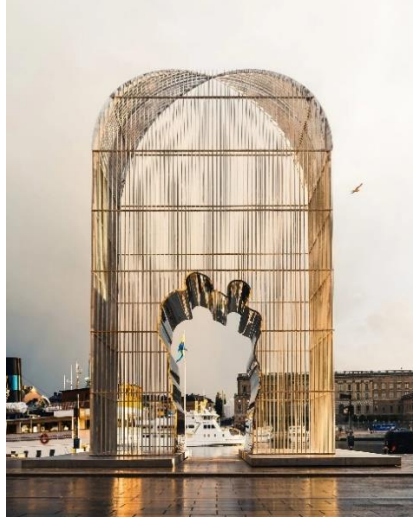
Şekil 3. Ai Weiwei, Kemer (Arch), Enstalasyon, İsveç, 2017.

Tecrit imgesine politik bir bakış açısı ile yaklaşan Rimma Gerlovina ve Valeriy Gerlovin, 1977 tarihli “Hayvanat Bahçesi (Zoo)” (Şekil 2) isimli çalışmasında çıplak olarak parmaklıklar arkasında üzerinde “Homo Sapiens, Memeliler Grubu, Erkek ve Dişi” yazan bir tabela ile performanslarını sergilemişlerdir. Bu çalışma, Sovyet toplumunda bireyin yeri ile ilgili politik bir bakış açısını ortaya koymaktadır (Fineberg, 2014: 452). Bu mahkûmiyetin siyasi bir nedeni olduğu gibi, birey üzerinde kurulan baskıyı ve hâkimiyeti kafese konulan hayvanlar ile eşdeğer görülmüştür.