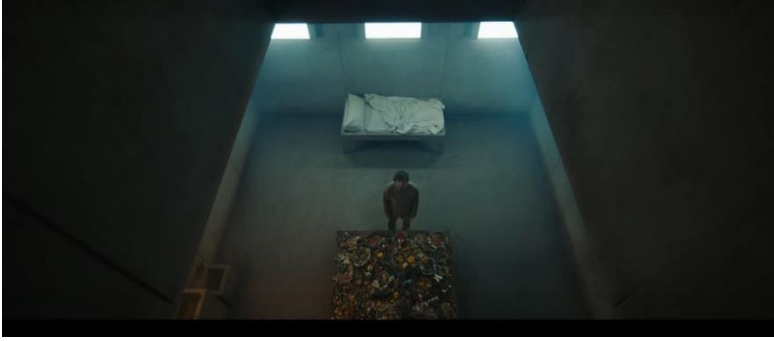
Şekil 9. Galder Gaztelu-Urrutia, The platform, 94 dakika, 2019.

Kara walker, (Şekil 8) Çalışmalarını siyah ve beyaz olarak gerçekleştirir ve silüetler ile oluşturulan kurguları, siyahiler üzerindeki baskıyı ve yaptırımları sert bir dil ile eleştirir. Kağıtları keserek uyguladığı tekniği, insan yüzünün biçimsel özelliklerine entelektüel ve psikolojik anlamlar atfeden fizyonomi ile ilişkilendirir. Bu tekniği “ırkın temsiliyeti” sorununu araştırıp, konuyu yapı söküm tekniği ile analiz etmeye yardımcı bir araç olarak kullanır. İnsan formunu iki boyutlu “özüne” indirgeyen sanatçı, böylece “öznelere” yanlış yorumlamaya, onlara çocuk muamelesi yapmaya ve kısıtlamaya devam eden bazı tek tipleştirme yöntemlerini irdeler (Wilson, 2015: 366).