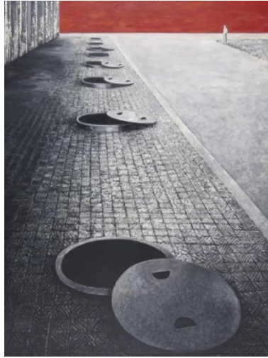
Şekil 10. Anzo (José Iranzo Almonacid), Tecrit 10, Tuval üzerine yağlıboya, 100 × 100 cm, 1967.

yapımı “Platform” (Şekil 9) filmi bu duruma iyi bir örnektir. Post modern toplum yaşamındaki yalnızlaşmaya ve hedonist anlayışın, yani insanın hazlarına odaklanan aynı zamanda hayvani dürtülerini ve bencilliğini de vurgulayan bir yapımdır. Toplumda yer alan sosyal statüleri, sınıf ayrımını acımasız bir biçimde izleyiciye yansıtır. Aslında bir hapisane olan yukarıdan aşağıya doğru inen çok katmanlı bir yapıdır. Yapının ortasında yer alan Platform belirli zamanlarda yukarıdan aşağıya inen yiyeceklerle dolu bir alanın yapının en üst katmanından en alt katmanına kadar inişine odaklanır. Herkese yetecek kadar yiyeceğin bulunduğu halde aç gözlülüğün, hırsların ve doyumsuzluğun odağında ilerleyen bir olay örgüsü içerisinde devam eder.