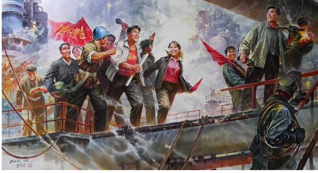
Şekil 11. Kuzey Kore Resmi (North Korea Painting).