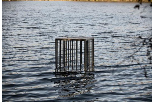
Şekil 5. Alfredo Jaar, İyiliğin ve Kötülüğün Bahçesi ( The Garden of Good and Evil), 2017, New York.

asında zayıf bir noktasını da açığa vurması ile dürüst ve kişisel bir yönünü de ortaya koymaktadır. Dağınık bir yatak, etrafa saçılmış bandajlar, alkol şişeleri, gebelik testi, oyuncak gibi birçok nesnenin yer aldığı çalışmada sürecin zorluğuna da odaklanmamız için güçlü kanıtlar ortaya koymuştur. Emin, aynı zamanda yaşadığı deneyimin hayatın birer parçası olduğunu, her bireyin yaşayabileceği ve yaşadığı bir dönem olduğunu hatırlatarak insanların yüzüne sert bir biçimde vurarak diğer insanlar ile kendisi arasında bu anlamda bir bağ kurmayı amaçlamıştır. Asıl amacı ise sosyal kısıtlamanın, yani gizlenmesi gereken bir sürecin ham ve doğal hali ile ortaya konulması ile bu gizliliğin duvarlarını yıkmaktadır ( https://lucawardblog.wordpress.com/2017/04/21/my-bed-tracey-emin/ , 2017).