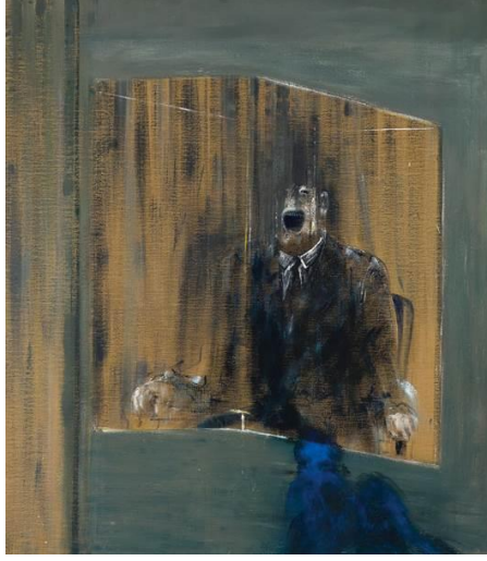
Şekil 1 . Francis Bacon, Bir Portre Çalışması (Study of a portrait), Tuval Üzerine Yağlı Boya, 149.4 x 130.6cm, 1949.