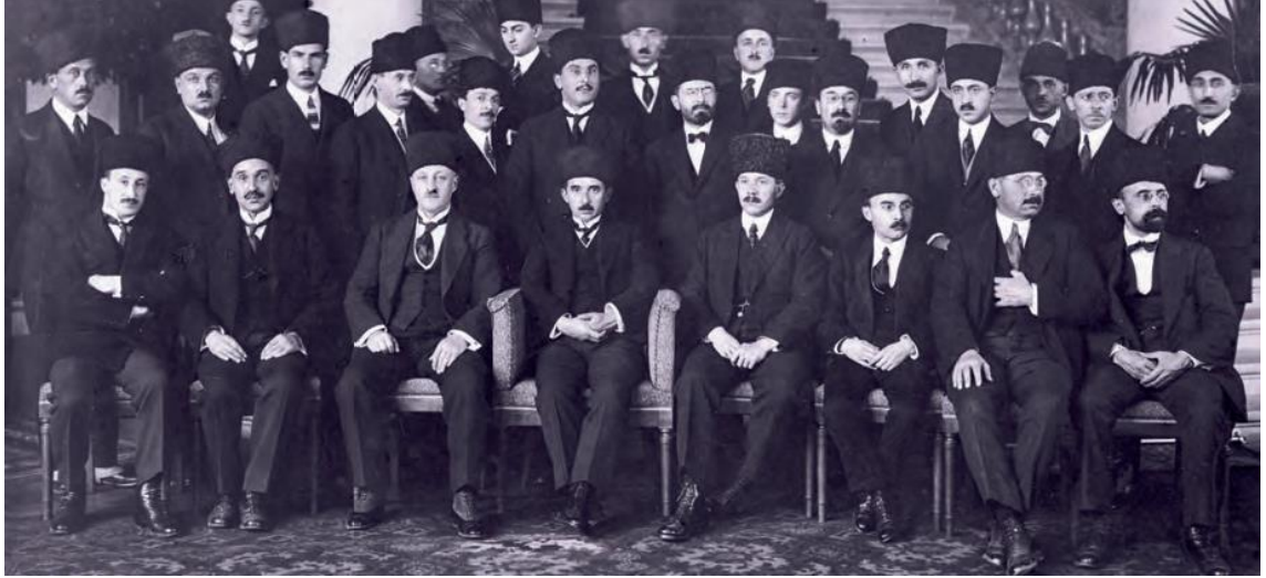
Şekil 12: Lozan Konferansı'na katılan Türk heyeti