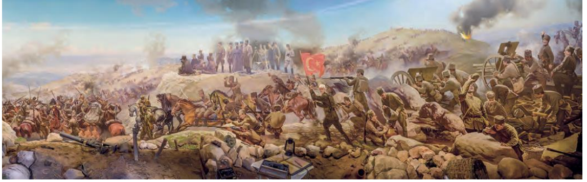
Şekil 6: Sakarya Zaferi Panoraması, Anıtkabir Atatürk ve Kurtuluş Savaşı Müzesi

Kaynak: Türkiye ortaokul 8. sınıf TCİTA ders kitabı, 2018: 93