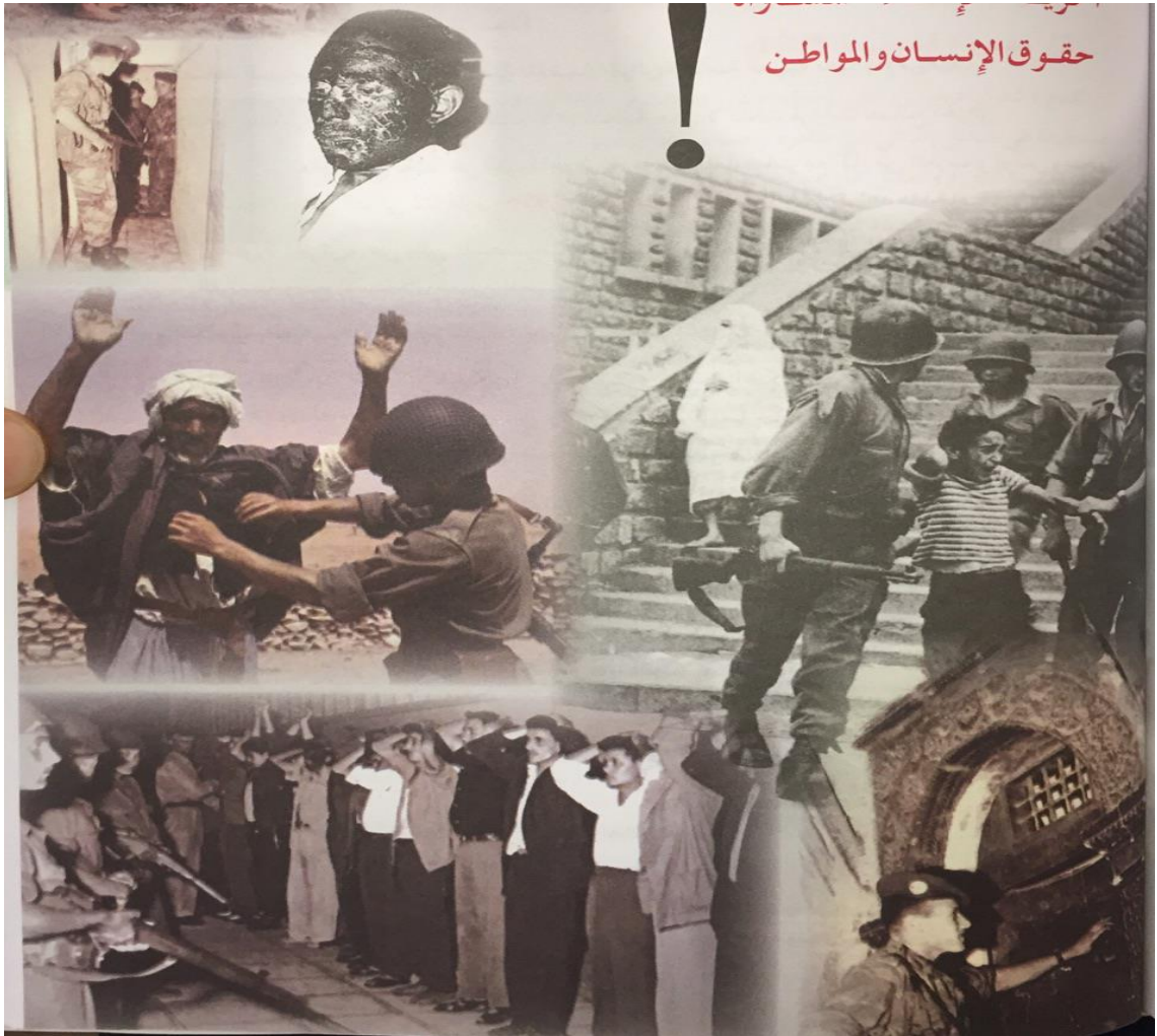
Şekil 11: Fransız askerlerinin yaptığı baskı, zulüm ve işkence