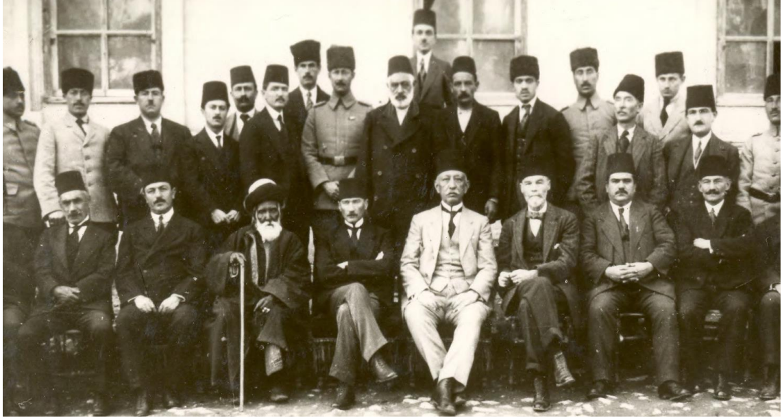
Şekil 1: Sivas Kongresi Temsilcileri