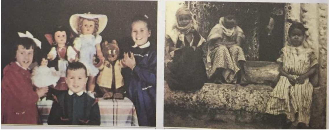
Şekil 4: Fransız çocuklar ve Cezayirli çocuklar

Kaynak: Cezayir ortaokul 4. sınıf tarih ders kitabı, 2017: 25