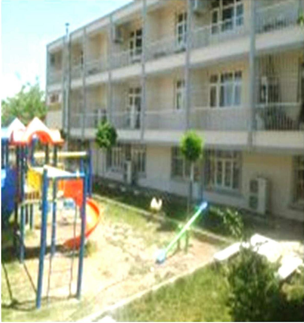
EK 9: SİİRT HALKEVİ BİNASININ BUGÜNKÜ HALİ