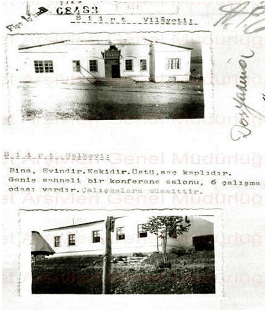
EK 3: SİİRT HALKEVİ BİNASI (BCA, 490.1.0.0.1002.871.2:157)