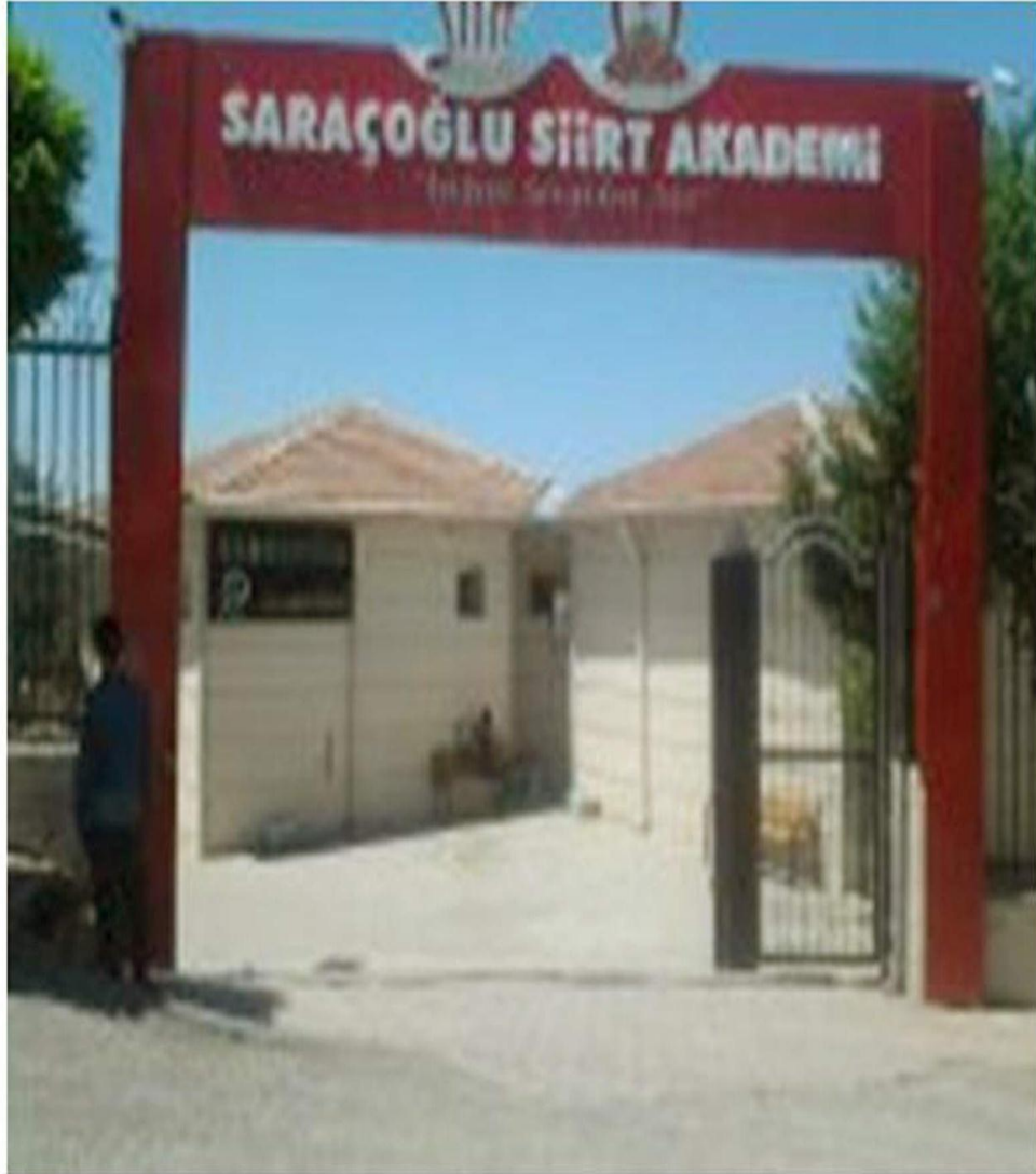
ŞİİR HALKEVİ BİNASININ BUGÜNKÜ DURUMU