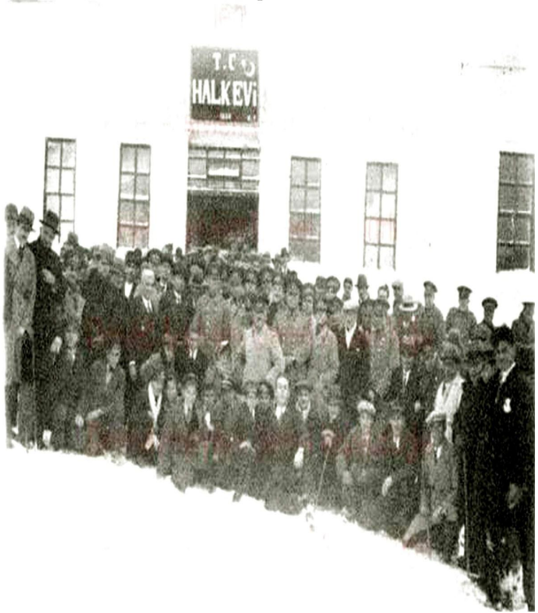
EK 2: SİİRT HALKEVİ YÖNETİMİ VE ÜYELERİ