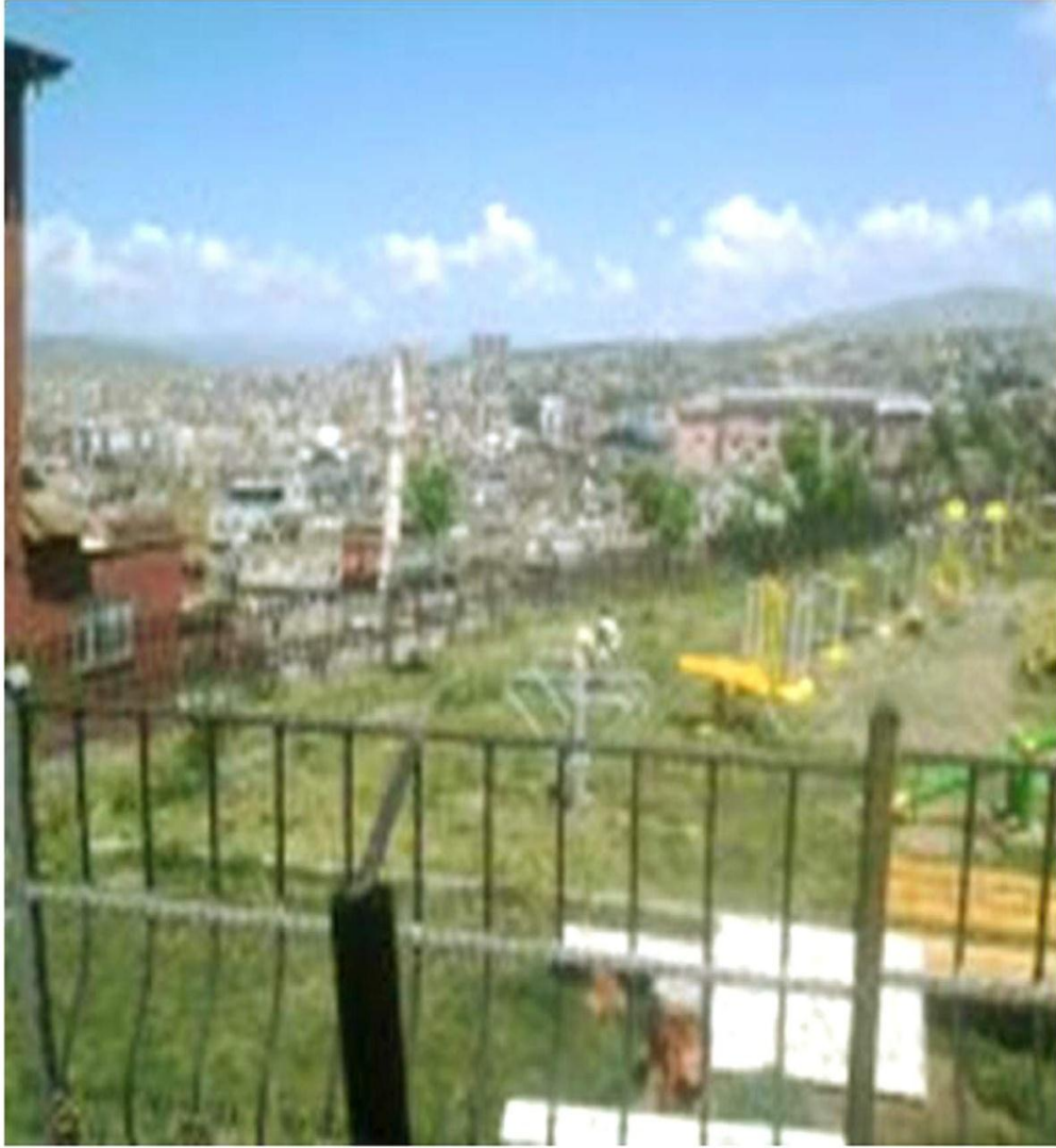
EK 10: SİİRT HALKEVİ BİNASINDAN ŞEHRİN GÖRÜNÜMÜ