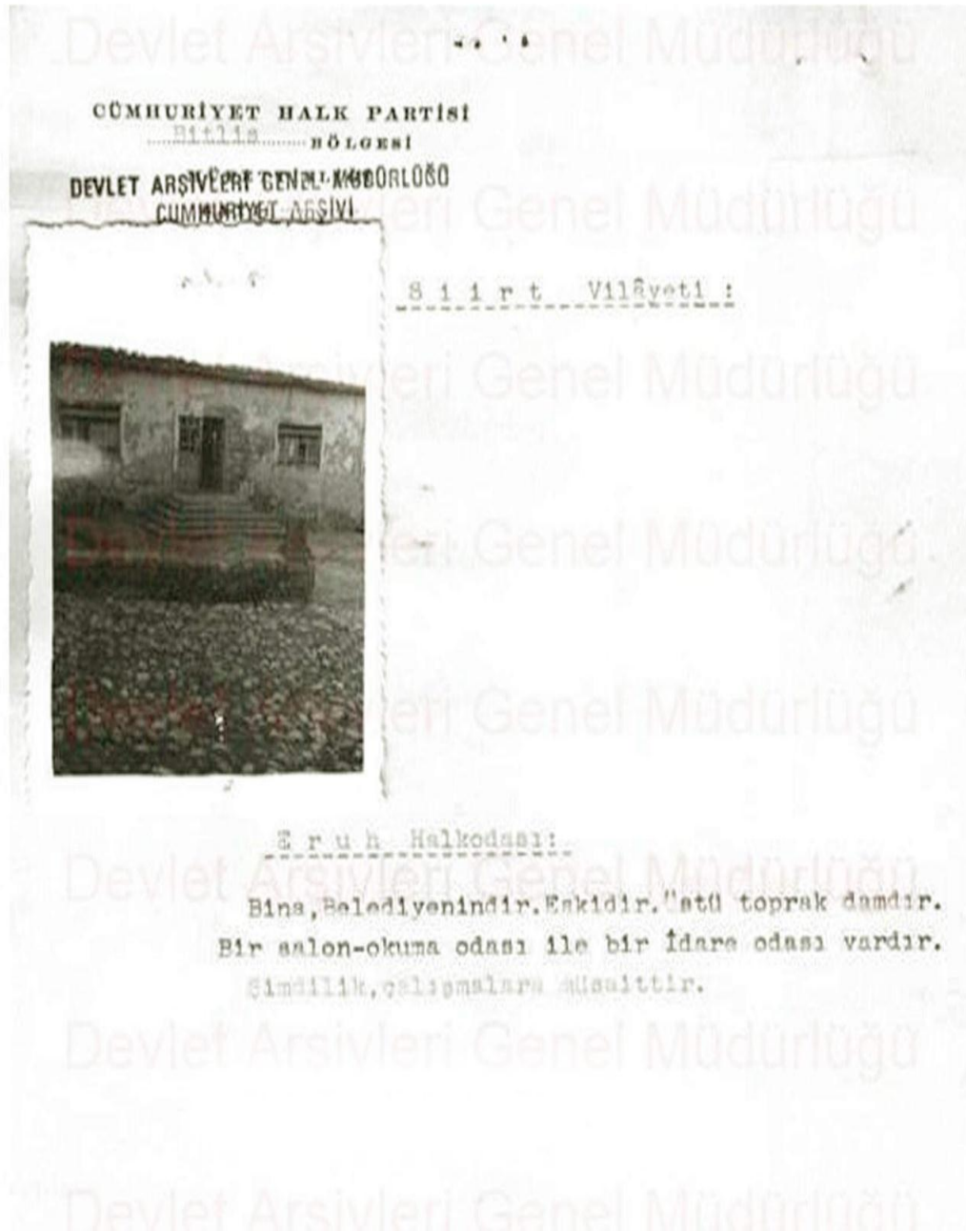
EK 7: ERUH HALKODASI BİNASI(BCA,490.1.0.0.1002.871.2:163)