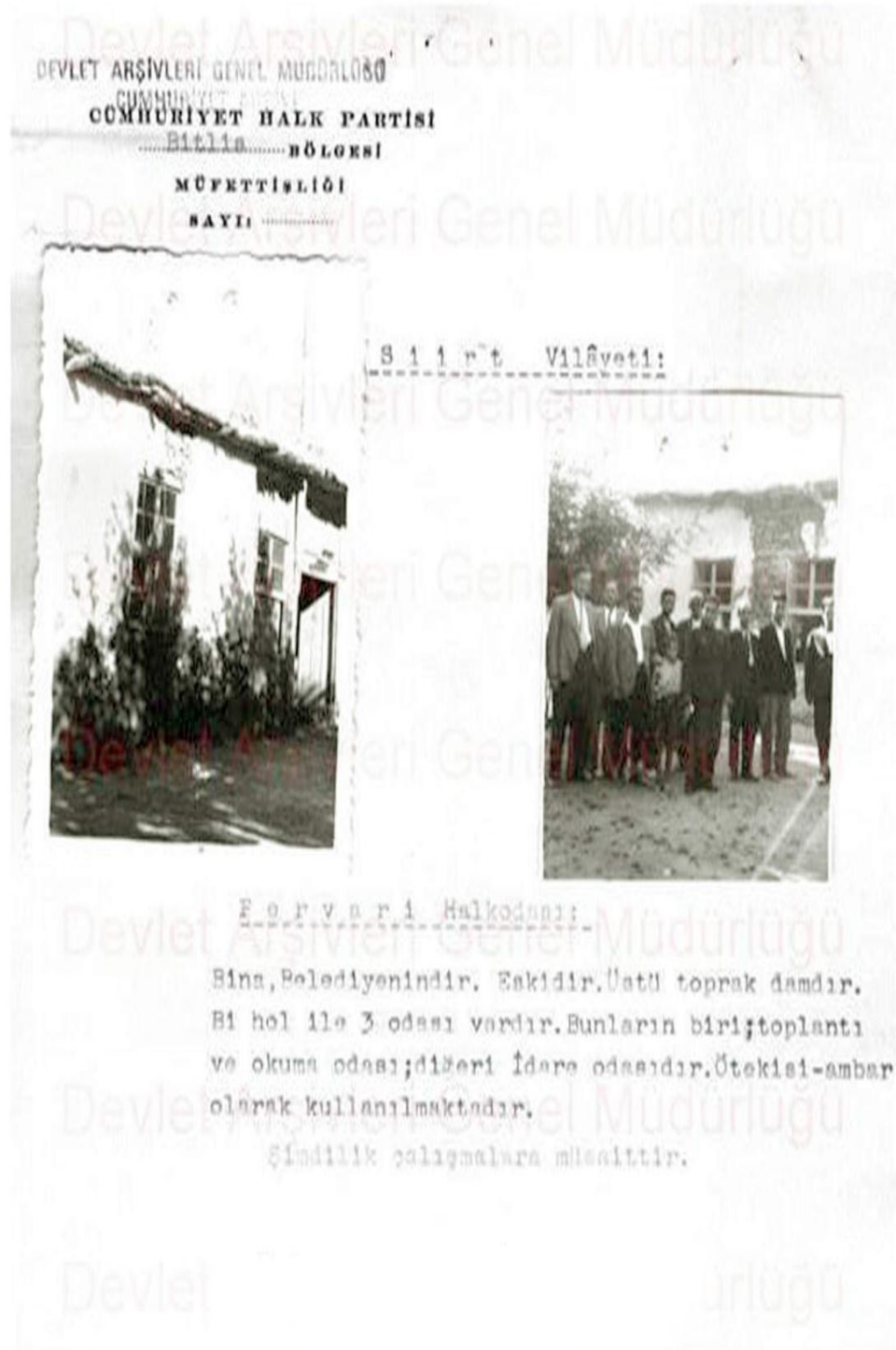
EK 6:PERVARI HALKODASI BİNASI(BCA, 490.1.0.0.1002.871.2:161)