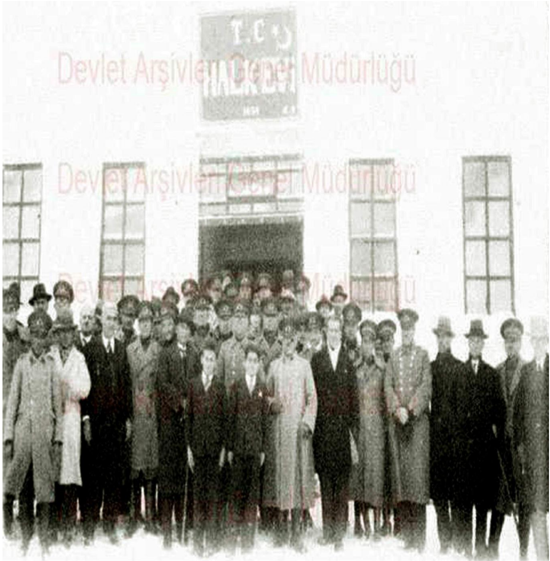
EK 1: SİİRT HALKEVİ ÜYELERİ (BCA, 490.1.0.0.961.720.1:19)