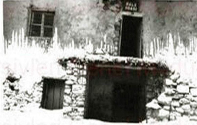
EK 4 Şirvan Halkodası Binası