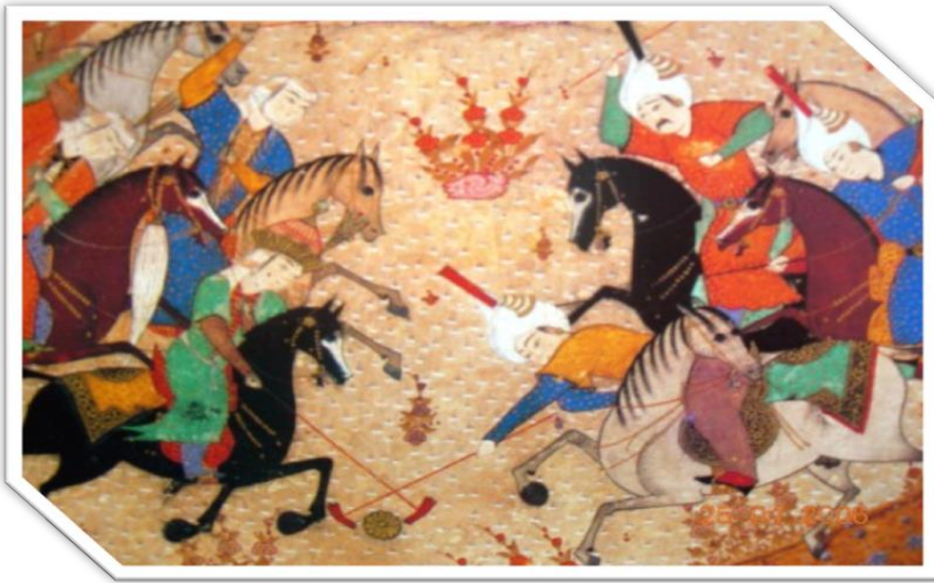
Resim 3: Osmanlı'larda oynanan Polo oyunu temsili (Web 7, 2018)

Çöğen (polo, çevgan) oyunu Türklerin Orta Asya'da icat ettiği milli bir oyundur. Oyun Babür Şah tarafından Hindistan'a götürülmüş, Tibetçe top anlamına gelen "Pulu" kelimesi zamanla Polo ismini almıştır (Başbuğ, 1986). Batu'ya göre eski bir Türk sporu olan çöğen, "polo" adıyla ilk olarak Hindistan'da 1854'te İngilizler tarafından oynanmış ve Avrupa'da ilk Polo Kulübü 1863'te kurulmuştur. Keten'e göre, Hindistan'a yerleşen Portekiz ve İngilizler bu oyunu burada görmüşler ve 1871'de İngiltere'ye dönen askerlerle bu oyunu Avrupa'ya götürmüşlerdir.