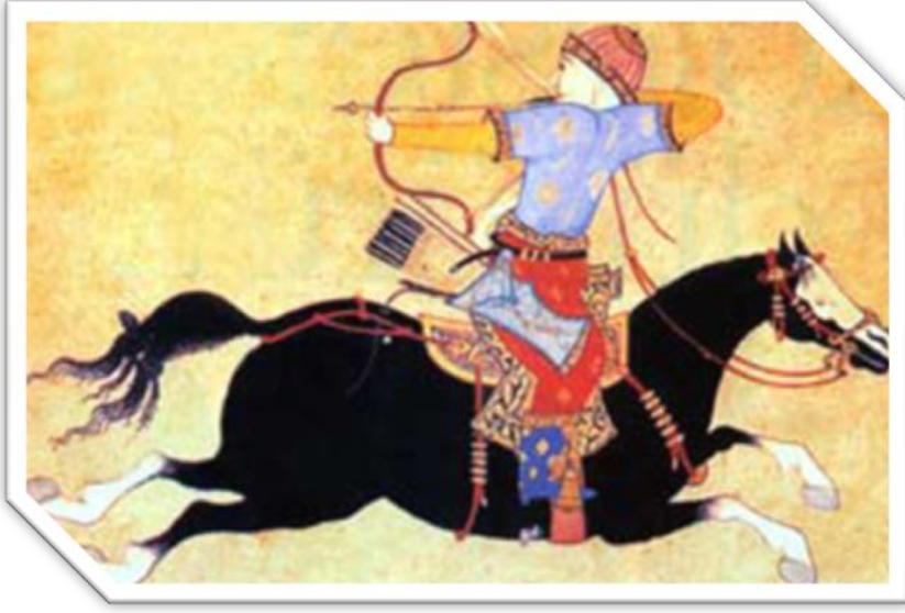
Resim 1: Eski Türklere Ait Binici Resmi (Web 5,2018)

Dünya'ya hakim olmuşlar ve yeryüzünde adaleti temsil etmişlerdir (Güleç, 2006).